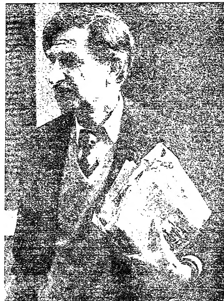
■ في كانون الاول ١٩٧٥ يحمل كتاب « مدرسة العنف » ■